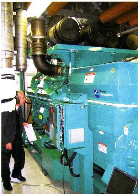
Die komplett integrierte Maschinensteuerung, der Schutz und die Regelung erlaubt es, alle Parameter jederzeit zu überwachen.