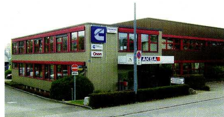
Der Firmensitz von AKSA an der Grosszelgstrasse in Würenlos.